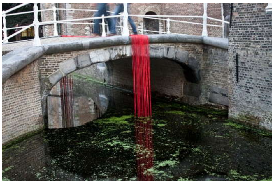
DATOS ARTÍSTICOS DE AMAYA BOMBIN